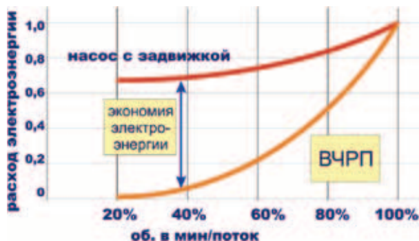
Типичные кривые потребления энергии для насосов

Для обеспечения транспортировки нефти в системе ОАО «АК «Транснефть» в течение года потребляется более 12 млрд кВт·ч электроэнергии, из которых потребление высоковольтными электродвигателями составляет более 80%, или 9,6 млрд кВт, что требует затрат в размере 28,8 млрд руб. Эта сумма затрат ложится на 1800 высоковольтных двигателей (из них синхронные электродвигатели – 53% и асинхронные электродвигатели – 47%, основной парк синхронных машин – это двигатели мощностью 2,0; 2,5; 4,0; 5,0; 6,3 и 8 МВт). Для технологического участка трубопровода из трех нефтеперекачивающих станций установлено, что при частотном регулировании одного из трех магистральных агрегатов экономия электроэнергии по сравнению с циклической перекачкой может составить 1500 МВт·ч в год. При стоимости электроэнергии 1,5 руб./кВт·ч и тарифе за мощность 700 руб./кВт годовая экономия может составить до 2,0 млн руб. в год. Аналогичные расчеты можно провести и для других предприятий нефтегазовой промышленности (ОАО «Газпром», ОАО «Роснефть», ОАО «Лукойл» и т.д.).